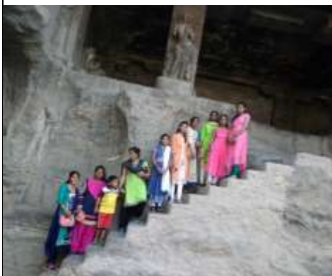
Historical Tour Visit, at Erola Cave 31/12/2017