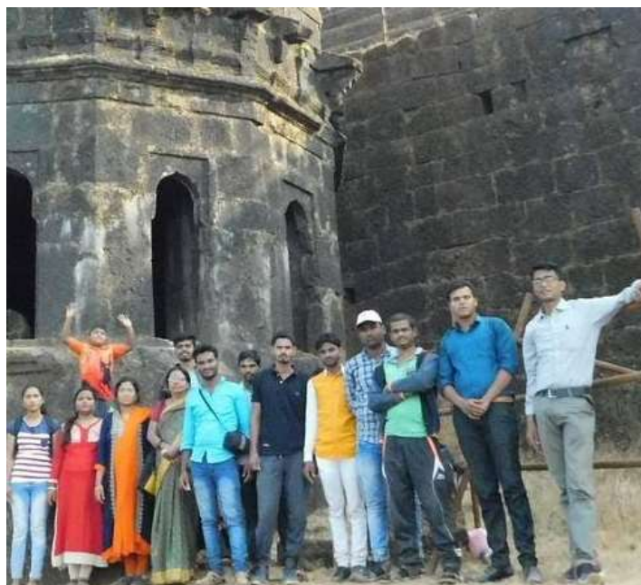
Historical Tour Visit, at Raigad Fort 15,16 January 2019