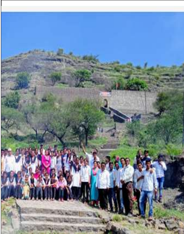
Heritage Walk 4 th February 2019