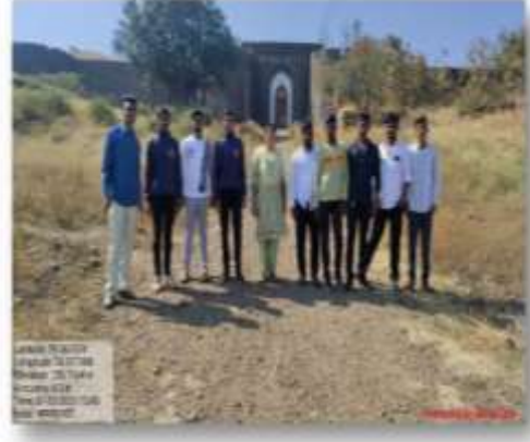
जग भुईकोट केले त्यांचे अन्वयगत. सर्व किल्ला सधू झाल्यानंतर विवेकानंद प्रगट्यातली सर्व विद्या संस्थे घुलली विवेकानंद वेतली व 3.00 काळात किल्ला बंदी घडले. हो क्षेत्र क्षेत्रभेट जग्याभाठी बांधकाम घालत राहीत. अन्वयगत.

याच जाय हो ऐतिहासिक दिवसांचे बाळात लाकडात इतिहास बाही करून घेलाचय तया विटांनी घालत विटांनी होत सधू हो जग्याच पूर्वबाठी बाळक्याच बाळाच्य अंतरात रथ तम्याचय घालीत आहेत. त्यांचे मजगटू बने जाय बाळाची रच आहे. यालाटूत जघीन व सध्यातूने बाळातील अनेक बाळा बने आहेत. जगात यहाचे बांधकाम का बनेले घालाठी बने जग या क्षेत्र वेटीत मिळते. हो एड कोनेजचे जग्याचे वेत या घाली बाधील होत केत बाटा घाल्याभाठी घालायची विटा व किल्लाची बाहीत असल्याच वेतू वेतू असल्या साह्यकार केले त्यांचे जग्या. त्याचमुळे इतिहास विभाग मुळूक हा. ताल घरें व ज. प्रकाश रथीत यांनी जग्या विद्यार्थीचे इतिहासाचे