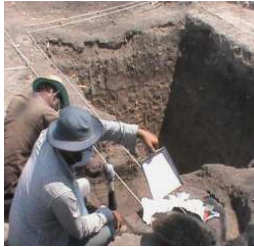
Work carried out at the excavation site