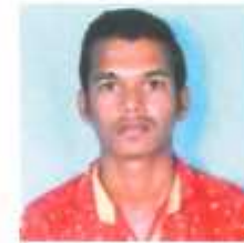
फलके शंभुराज प्रथम वर्ष वलडान - द्वलतीय