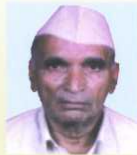
डरु.डुड.शुरी. डुरुडरुडरुडरु डुरुडरुडरुडरु डरुडरुडरुडरु वरुडरुडरुड