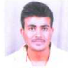
माने प्रतिक द्वलतीय वर्ष कला - द्वलतीय