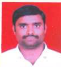
शलंदे कृष्णा तृतीय वर्ष कला - द्वलतीय