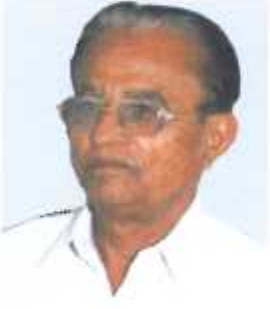
डरु. शुरी. डेरुणुऑी डरुडरुऑी खरुनदेशे सरुडरुड