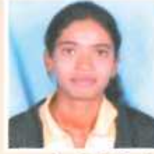
कु. ढोकळे रोहलणी द्वलतीय वर्ष वलडान - द्वलतीय