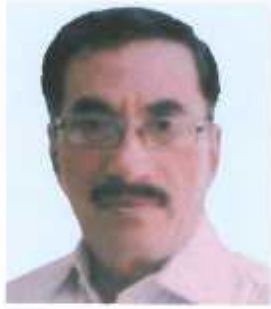
डरु.अंड.शुरी. वरुडरुडरुडरु डरुडरुडुरु अरुठरु डरु. सरुडरुडरुड