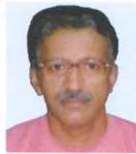
डरु.डुड.शुरी. वरुडरुड डुरडरुडरु डरुडरुडरु खऑरुनडरुडरु