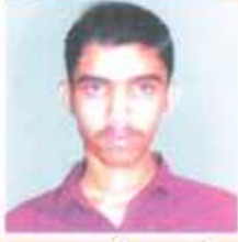
जगदाले ज्ञानदेव द्वलतीय वर्ष वलडान - प्रथम