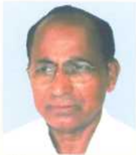
डरु.डुड.शुरी. डुरुडरुडरुडरु डुरुडरुडरु डरुडरुडरु वरुडरुडरुड