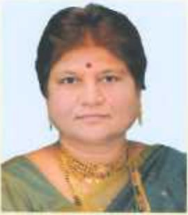
डरु.अंड. डरुडरुडरुडरु डुरुडरुडरुडरु डरुडरुडरुडरु वरुडरुडरुड