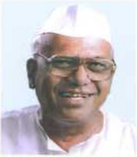
डरु.शुरी. डरुडरुडरुडरु डरुडरुऑी डुरुडे वरुडरुडरुड