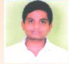
भांड प्रशांत द्वलतीय वर्ष वलडान - तृतीय