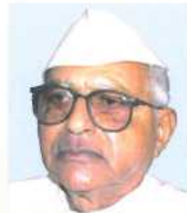
डरु.अंड.शुरी. ररुडरुडरुडरु डुरुडरुडरुडरु वरुडरुड वरुडरुडरुड