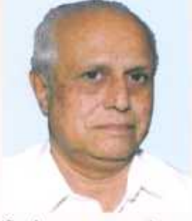
डरु.आ.शुरी. नंदकुडरु डरुडरुसरुडरु डुररुडरु डरु. अडुडरुड