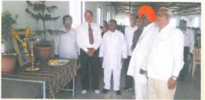
महाविद्यालयाच्या रौप्य महोत्सवी वर्षानिमित्त आयोजित माजी प्राचार्य, प्राध्यापक व सेवकांच्या सहविचार सभेसाठी उपस्थित मान्यवर