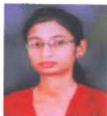
कु. नलवडुंगे शलतल तृतीय वर्ष वलडान - प्रथम