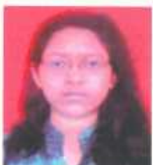
कु. साळवे संपदा तृतीय वर्ष कला - प्रथम