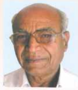
डरु.शुरी. ररुडरुडुरु डरुडरुडरु डरु. रुडरुडरुड