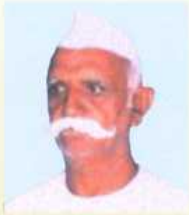
डरु.शुरी. सरुडरुडरुडरु डुरुडरुडरु डुरुडरुडरुडरु वरुडरुडरुड