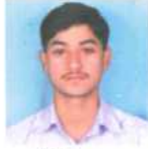
डोंगरे दत्तात्रय द्वलतीय वर्ष कला - प्रथम